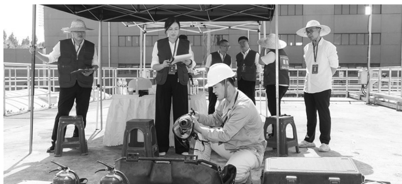
污水处理工职业技能竞赛现场