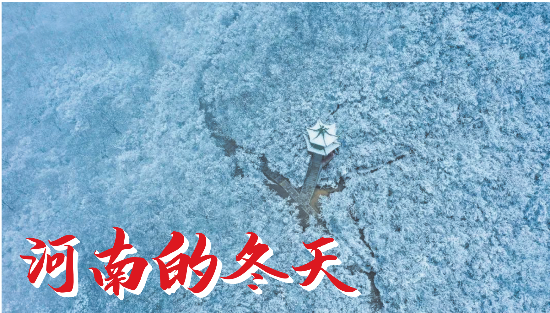
每一处冬景都令人陶醉

冬至过后，“数九寒天”正式开始，当北风呼啸而过，当雪花悄然飘落，河南的冬天，宛如一幅徐徐展开的绝美画卷，即将上线最令人陶醉的冬日美景。